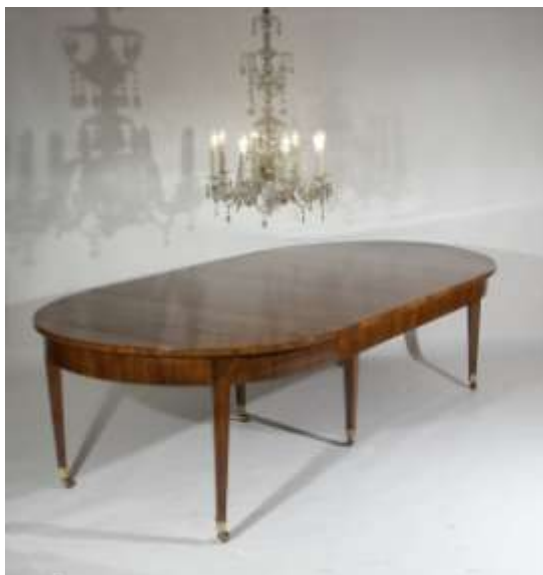
Auszugtisch Directoire, Anfang 19. Jh., Bern. Bis zu 18 Personen