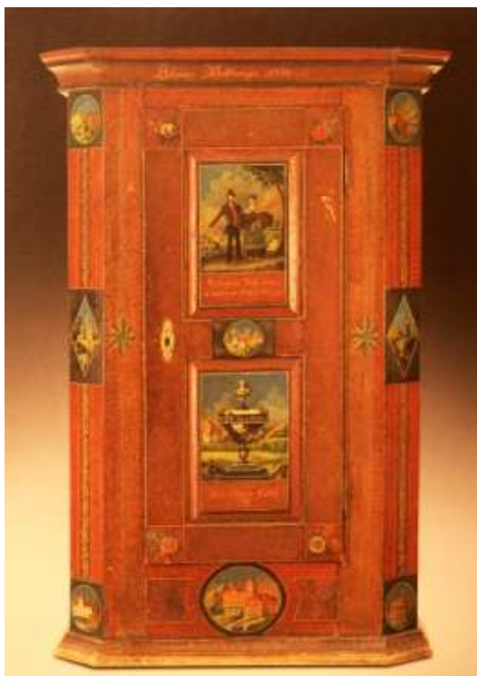
Appenzeller-Kasten 1839, Umkreis Thäler