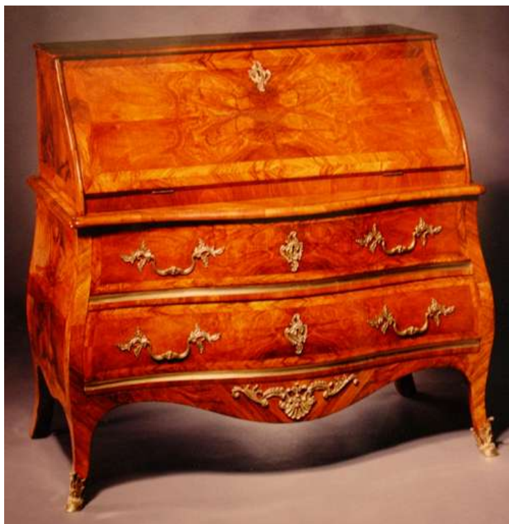
Schreibkommode Louis XV, Bern