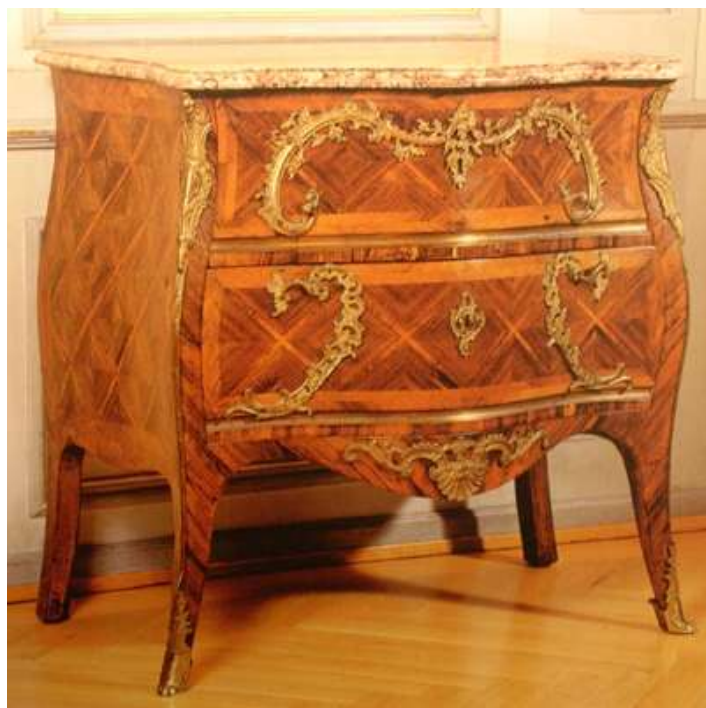
Kommode Louis XV, Mathäus Funk, Bern (1697 – 1783) Topmodell