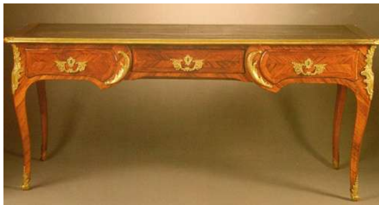
Bureau plat, Louis XV, Mitte 18. Jh. Paris, Edelhölzer, intarsiert. Meist signiert.